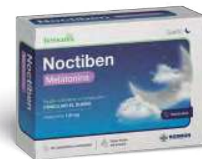
Complemento alimenticio con edulcorantes