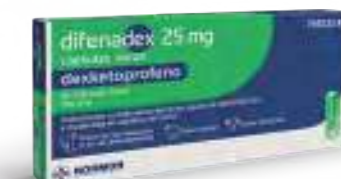
Medicamento no sujeto a prescripción médica