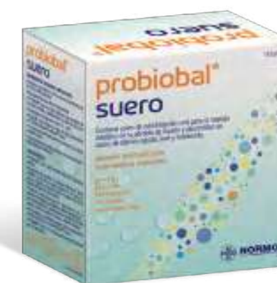
Alimento para usos médicos especiales