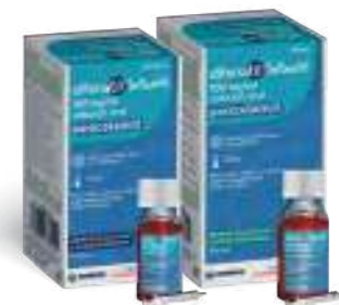
Medicamento no sujeto a prescripción médica