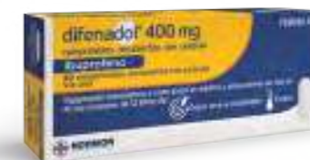
Medicamento no sujeto a prescripción médica