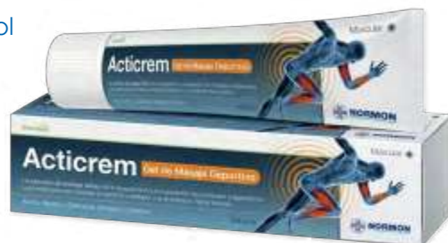
Producto de higiene