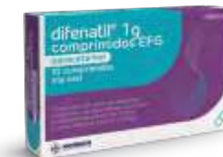
Medicamento no sujeto a prescripción médica