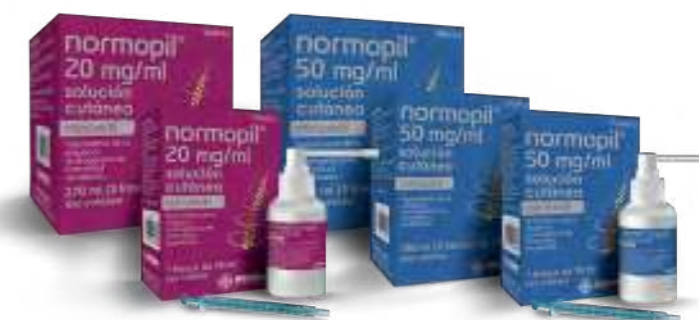
Medicamentos no sujetos a prescripción médica