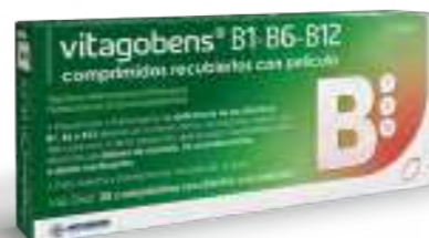
Medicamento no sujeto a prescripción médica