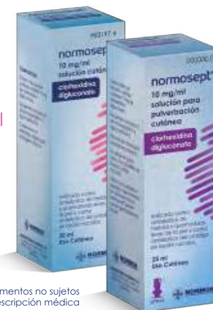
Medicamentos no sujetos a prescripción médica