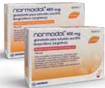
Medicamento no sujeto a prescripción médica