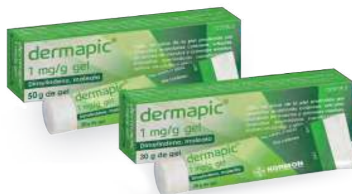
Medicamento no sujeto a prescripción médica