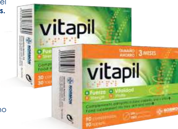
Complemento alimenticio con edulcorantes.